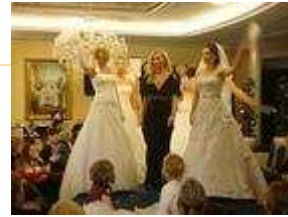
Die zahlreichen Aussteller helfen gerne bei der Planung der individuellen Traumhochzeit.

Karten für die Messe gibt es unter www.hochzeitsmesse-bocholt.de An der Tageskasse kosten die Karten zehn Euro.